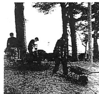
(マラソンコースの整備)