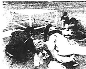
(指揮台のペンキ塗り)