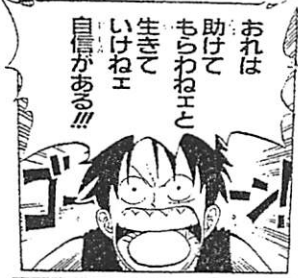
週刊少年ジャンプ ONE PIECE 作 尾田栄一郎氏